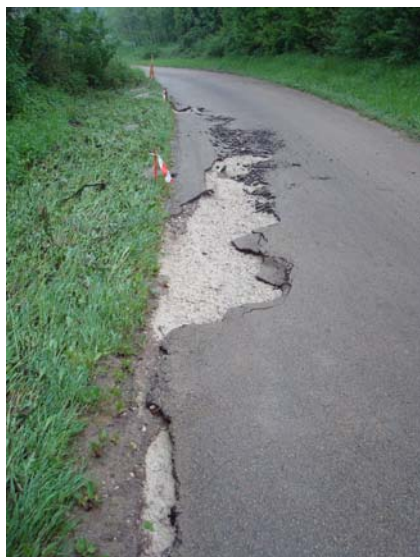
Violent orage de mai 2016

Le comité de Saint Vincent subventionne à 80 % le remplacement du fourneau de la salle des fêtes, fourneau qui est hors d'usage.